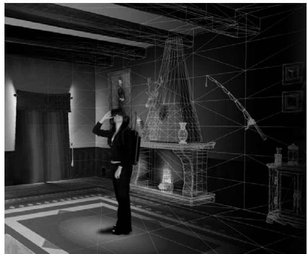
Figura 1 El visitante en el Museo Vacío

El Museo Vacío La Realidad Virtual, entendida en su sentido más inmersivo constituye un medio ideal para ubicar al visitante en lugares y situaciones imposibles de recrear en el mundo real, pero que pueden resultar de gran valor didáctico y descriptivo. Su uso sin embargo está muy limitado en el ámbito museístico por ser esta aún hoy una tecnología experimental. En ese sentido, el Museo Vacío se diseñó para potenciar la sencillez del sistema en su manejo y formas de interacción, a la vez que se ofrecía al usuario un equipamiento para ser llevado consigo atractivo y libre de cables que le permitiese transitar libremente por una sala vacía en apariencia, pero repleta de contenidos una vez que el visitante se ve inmerso en el espacio virtual. (Figura 1)