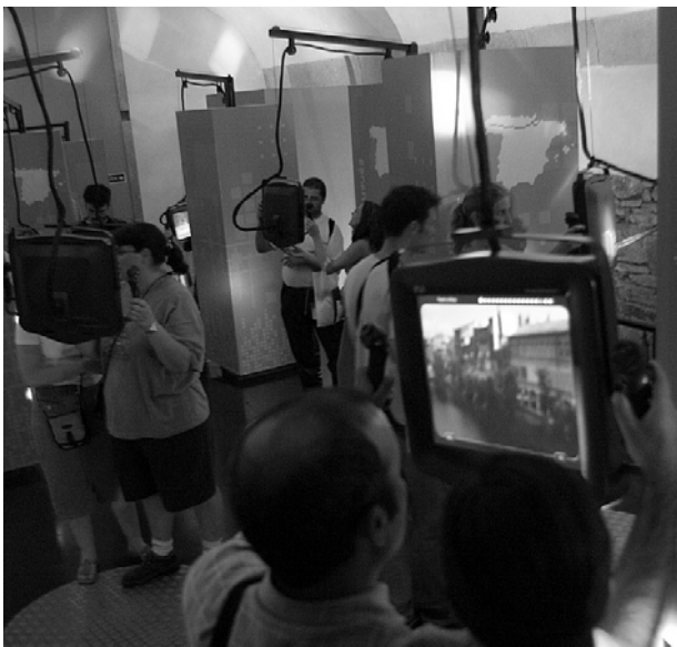
Figura 2 Ventanas virtuales

Caminos de Santiago: La instalación cuenta con varios de estos dispositivos, cada uno de los cuales permite la visita de distintos paisajes y poblaciones de cada una de las cinco rutas principales que componen este fenómeno de peregrinación dentro de la Península Ibérica, como aparecen en la Figura 2 .