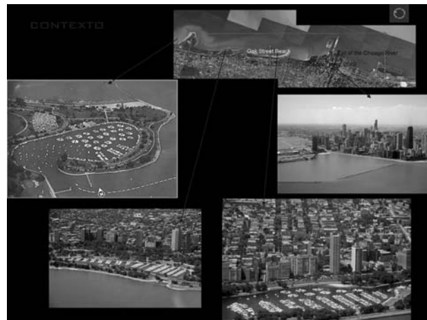
Figura 1 Contexto de Montrose Harbor.

Desarrollo (metodología) El método que se utilizó para la recopilación de datos fue de corte cualitativo apoyándose en observaciones participantes, entrevistas y levantamientos de campo, (Groat, 2002), todo esto realizado en el taller de arquitectura de séptimo semestre de la Universidad Autónoma de Aguascalientes UAA, agosto-diciembre del 2006.