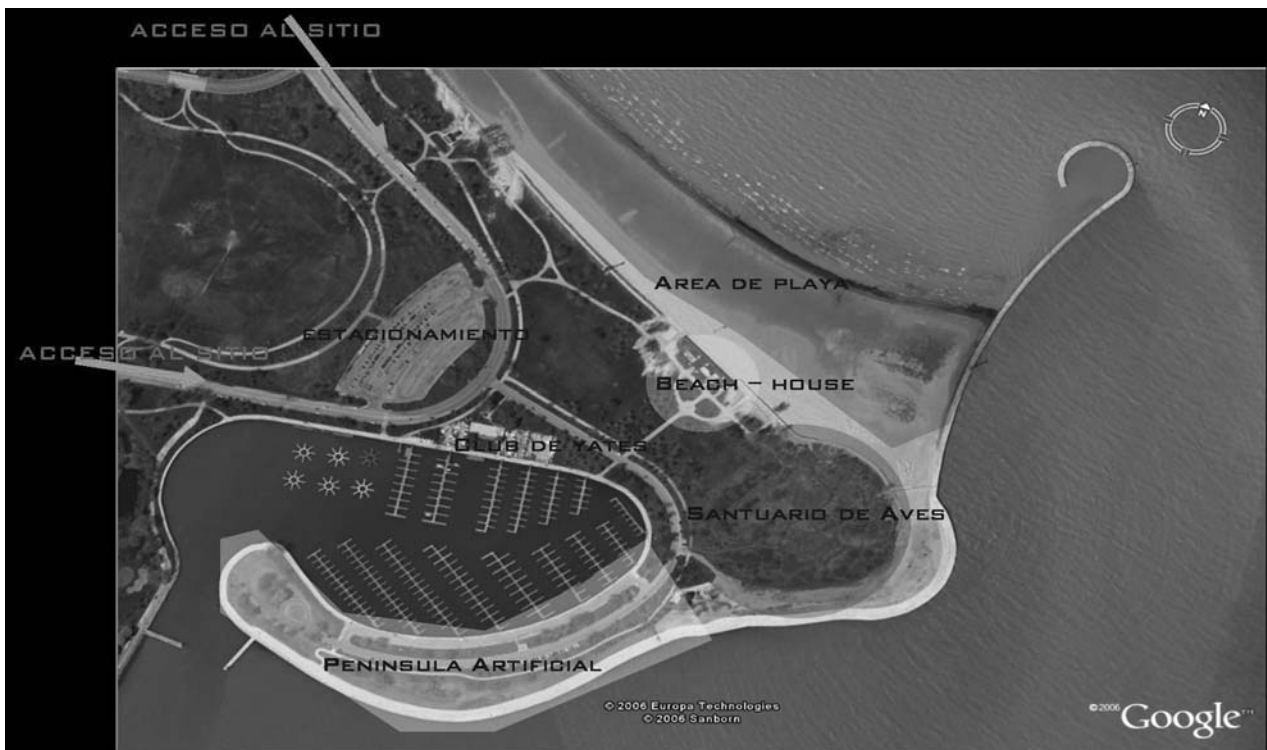
Figura 2 Análisis del terreno.