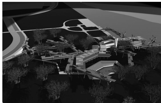
Figura 4 Propuesta posterior al 1 de Octubre.