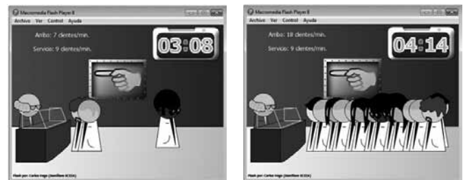
Figura 2. Escenario 1. Modelo M/M/1, sistema estable / Figura 3. Escenario 2. Modelo M/M/1, sistema desbordado