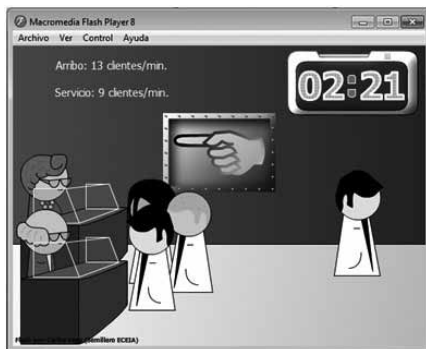
Figura 4. Escenario 3. Modelo M/M/s

En este caso, el sistema ya se encuentra transformado en un modelo M/M/s: infinito, es decir, de múltiples servidores. La capacidad de atención de los dos servidores es mayor a la capacidad de la demanda (Fig. 4); por tal motivo, el sistema se encausa nuevamente y no se genera una cola infinita. El OVA contiene un análisis de los indicadores de gestión para cada escenario, a fin de comparar los costos asociados con ellos y el comportamiento general del sistema. Para ejemplificar un poco más se muestran los indicadores del tercer escenario (Tabla 2).