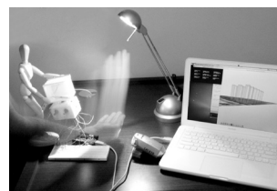
Fig. 2. Exemplo da concepção geral da interface