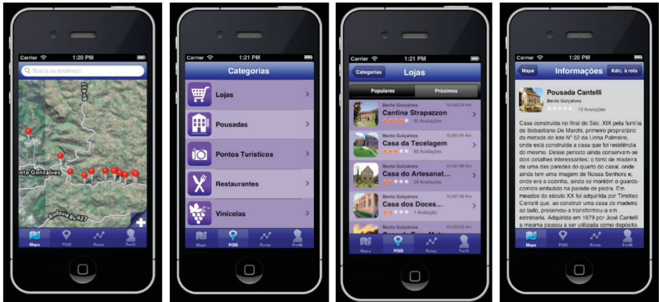
Figura 1: Protótipo desenvolvido para iOS da região dos Caminhos de Pedra. As imagens mostram algumas telas da versão para iPhone: Atividade principal com mapa e pontos turísticos; tela com pontos turísticos organizados por categoria; detalhamento de um ponto turístico; avaliação de um ponto turístico e compartilhamento via redes sociais.

segundo cenário de avaliação demonstra a utilização do modelo em uma visita não planejada ao Itinerário Cultural objeto da pesquisa, no qual o aplicativo deverá sugerir as informações e demandas que o usuário necessite para resolver a rota.